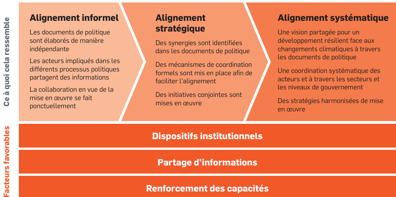
Figure 2. Le continuum en matière d'alignement

La localisation des pays sur ce continuum dépendra de différents facteurs, notamment :