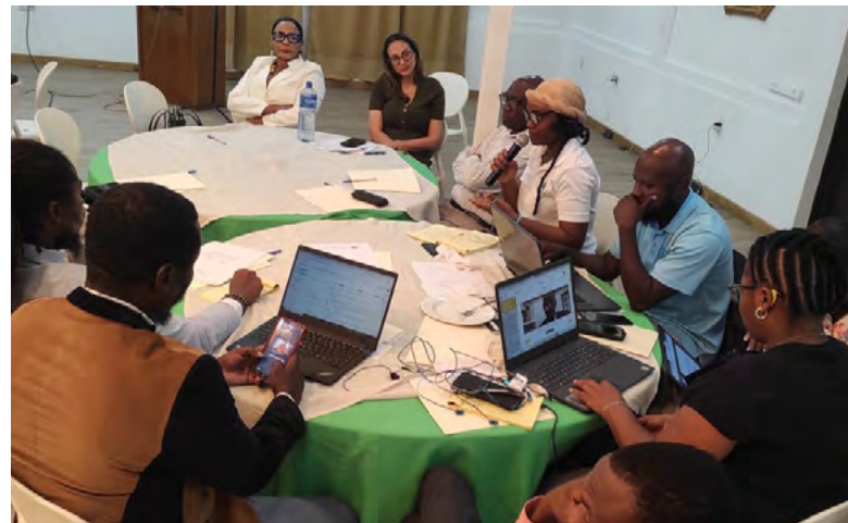
Atelier de consultation à Port au Prince. (MDE)