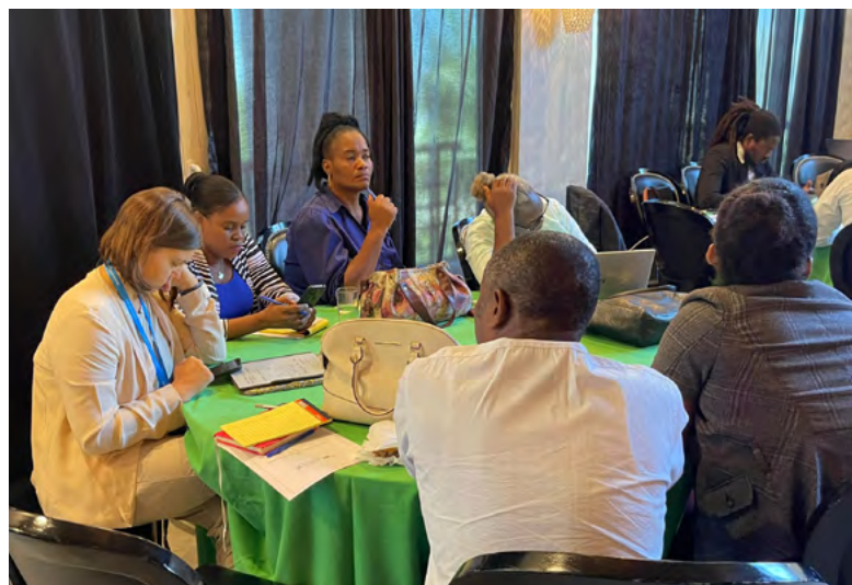
Atelier de Validation à Port au Prince. (MDE)

Cette priorité a pour but de mettre en place des dispositifs institutionnels visant à s'assurer que les investissements publics pour la mise en œuvre du PNA promeuvent l'égalité des genres.