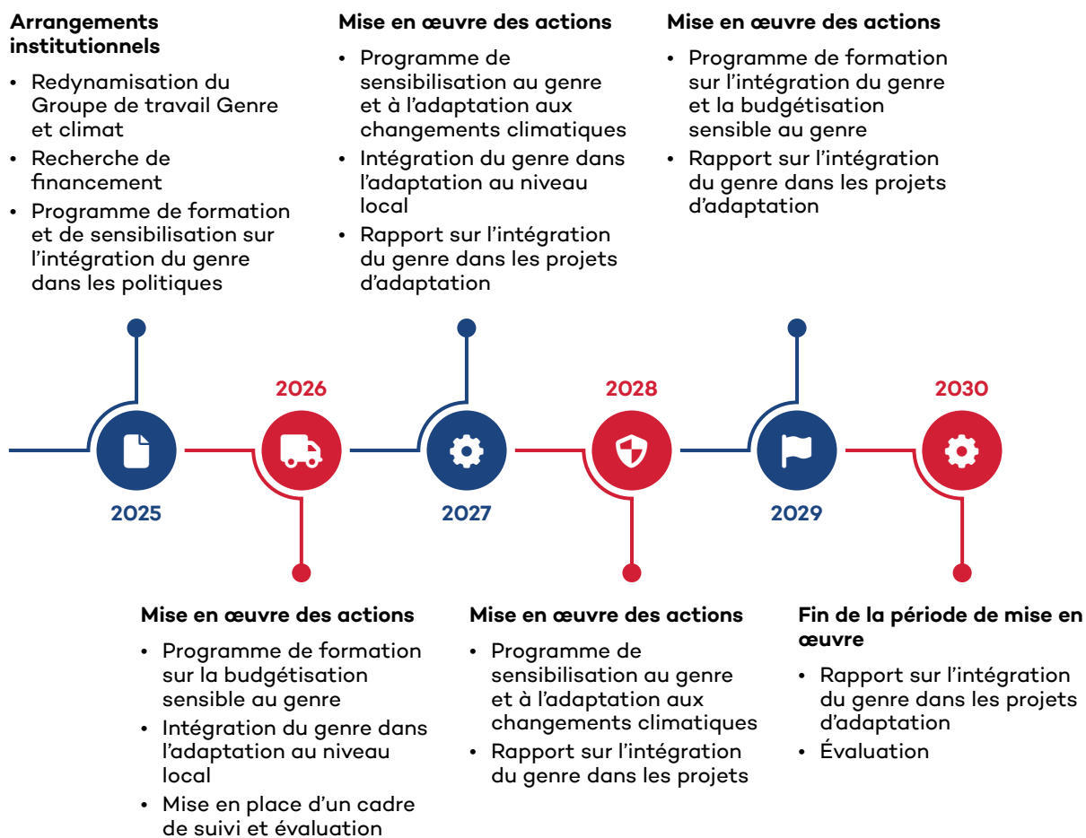
Figure 2. Feuille de route de la mise en œuvre du Plan d'action genre et adaptation aux changements climatiques