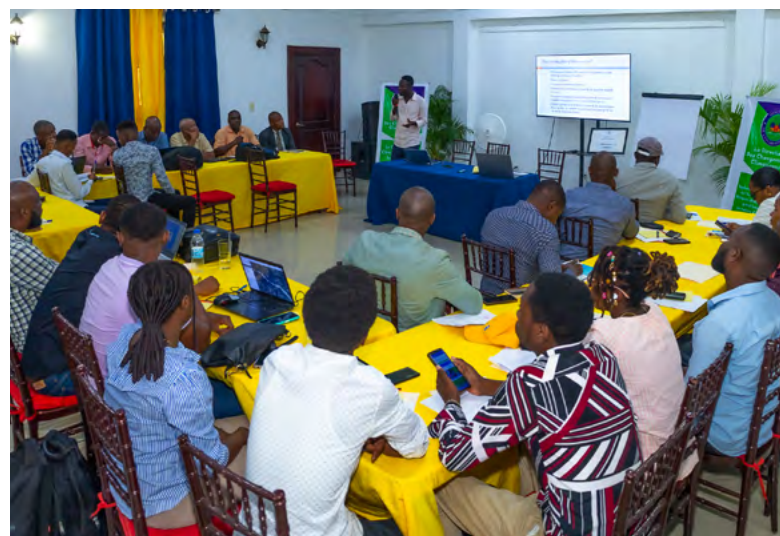
Atelier de consultation à Cap-haïtien. (MDE)

En 2010, la Conférence des Parties à la CCNUCC, dans sa Décision 1/CP.16 (par. 130), a décidé d'inclure les aspects liés à la problématique de l'égalité entre les genres dans les actions d'appui au renforcement des capacités dans les pays en développement aux niveaux infranational, national ou régional (CCNUCC, 2011).