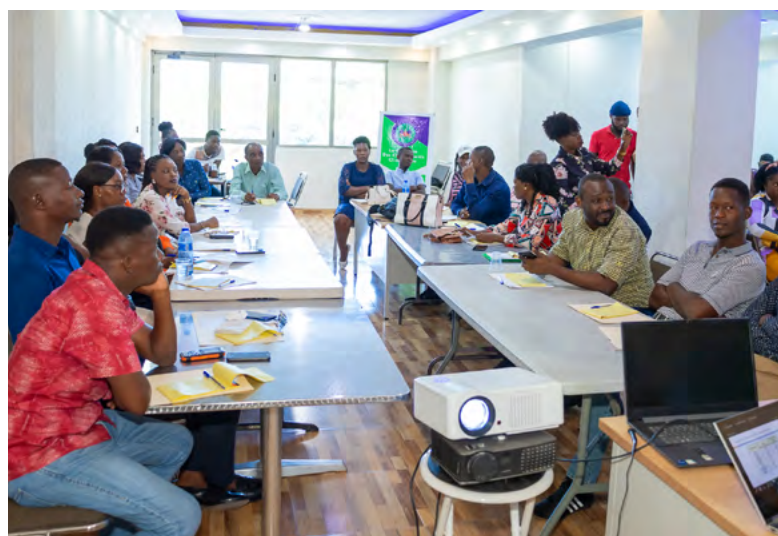
Atelier de consultation à Gonaïves. (MDE)

La première version du Plan d'action genre et adaptation aux changements climatiques prenant en compte les commentaires des commanditaires et les résultats des ateliers de consultations a été présenté aux acteurs concernés lors d'un atelier de validation. Cet atelier visait un double objectif : 1) finaliser et valider le plan d'action révisé et 2) établir les bases de son appropriation par les parties prenantes. À la suite de cette validation, un plan de vulgarisation devra être établi et mis en œuvre par la DCC du MDE en collaboration avec les parties prenantes clés, notamment le Groupe de travail Genre et climat et les Unités Genre des Ministères (UGM) sectoriels.